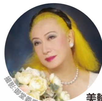
美輪明宏 (歌手/俳優/演出家)

→プレカンファレンス ビッグパレットふくしま in 福島 11/9(日)・10(月)