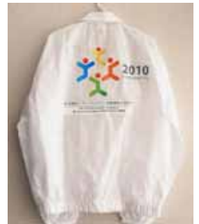
ウインドブレーカー

会場誘導(浜松駅): 10月30日(土) 4名 8:00～17:00 10月31日(日) 4名 8:00～17:00 11月1日(月) 4名 8:00～17:00 11月2日(火) 4名 8:00～17:00 11月3日(水・祝) 4名 8:00～17:00