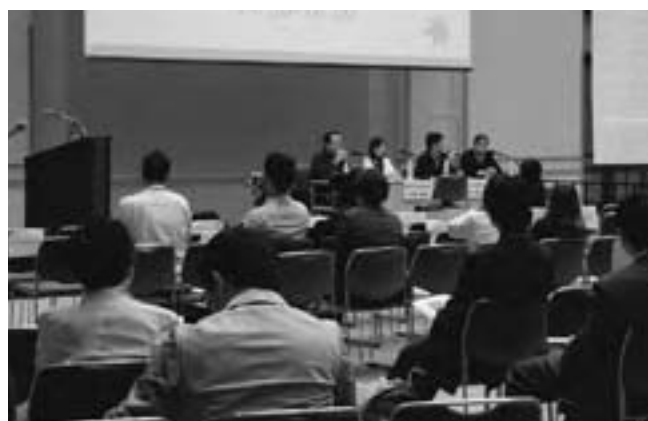
パネルディスカッション Panel discussion

誌面の都合で、発言の要旨のみの掲載になったが、3年間の活動が一歩ずつ前進していることは伝わった。そして、課題はそれぞれの参加者の立場で認識され、今後への礎になっていることが感じられたセッションであった。中期計画に従い、今後も「対話の実践」を具体化する活動は活発化していく。4年後には、また異なる評価が私たちを待っていると思う。