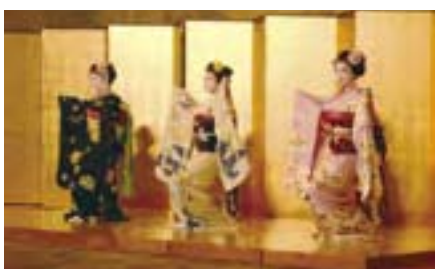
歓迎レセプション(ウェスティン都ホテル京都)

His Imperial Highness Prince Tomohito visiting Exhibition