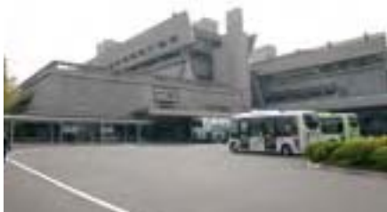
会場となった国立京都国際会館

Venue: Kyoto International Conference Hall