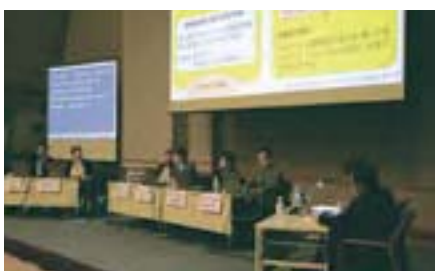
特別セッション「日本の進むべき道」

Welcome Reception, The Westin Miyako Kyoto