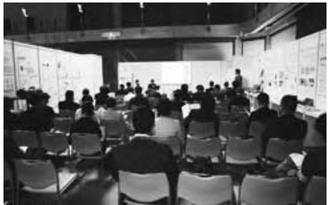
京都コーナーで行われたプレス説明会

UD2006では2002年の横浜での会議に続いて、日本のUD視点における質の高いモノづくりに対し、国際的に高い評価を得ました。今後の超高齢社会のモデルケースとして、あらゆる場を活用し、このような日本におけるUDの先進事例を積極的に世界へ発信し