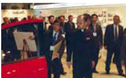
展示会を見学される寛仁親王殿下

His Imperial Highness Prince Tomohito visiting Exhibition