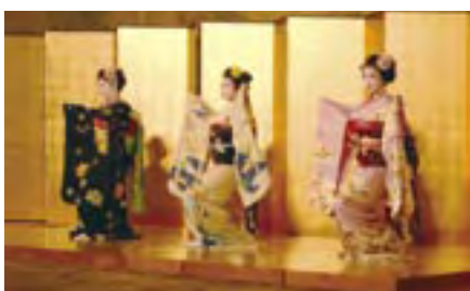
歓迎レセプション(ウェスティン都ホテル京都)

His Imperial Highness Prince Tomohito visiting Exhibition