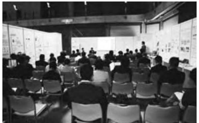
京都コーナーで行われたプレス説明会

UD2006では2002年の横浜での会議に続いて、日本のUD視点における質の高いモノづくりに対し、国際的に高い評価を得ました。今後の超高齢社会のモデルケースとして、あらゆる場を活用し、このような日本におけるUDの先進事例を積極的に世界へ発信し