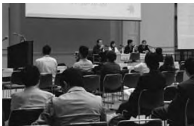
パネルディスカッション Panel discussion

誌面の都合で、発言の要旨のみの掲載になったが、3年間の活動が一歩ずつ前進していることは伝わった。そして、課題はそれぞれの参加者の立場で認識され、今後への礎になっていることが感じられたセッションであった。中期計画に従い、今後も「対話の実践」を具体化する活動は活発化していく。4年後には、また異なる評価が私たちを待っていると思う。