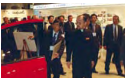
展示会を見学される寛仁親王殿下

His Imperial Highness Prince Tomohito visiting Exhibition