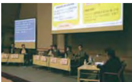
特別セッション「日本の進むべき道」

Welcome Reception, The Westin Miyako Kyoto