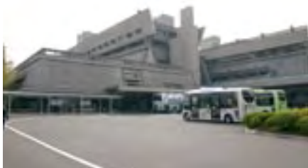
会場となった国立京都国際会館

Venue: Kyoto International Conference Hall