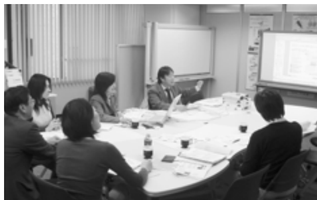
IAUD サロンを利用した会議の様子 A meeting held at the IAUD Salon