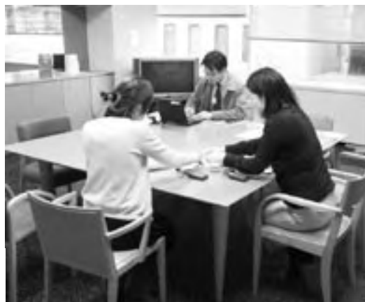
ユーザーインタビュー Interview with end users

2005年度の成果を踏まえ、2006年度は三つのテーマに絞って活動していきたいと考えています。一つ目は、デザインするだけでなく、「提案・アイデアのブラッシュアップ」を行うことです。二つ目は「検証」で、モックアップなどを使ったテストをしてみたいと考えています。三つ目は「標準化WGとの連携」で、効率と実用性を目的とした連携を図っていきたいと考えています。