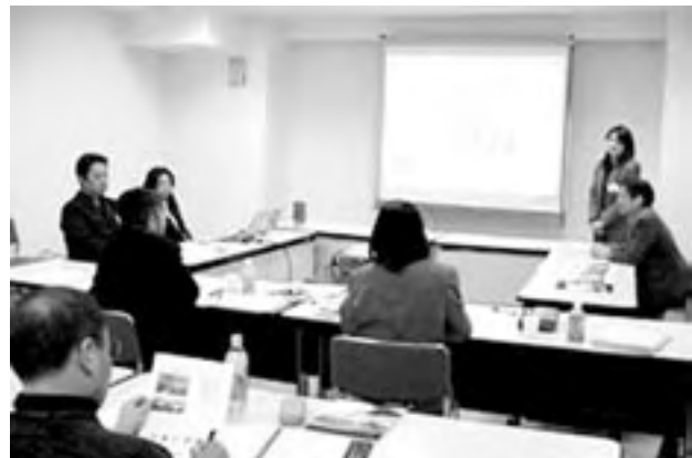
2次プレゼンテーション審査風景 Second stage, presentation hearing

今後、本審査の実施に向け、審査員の人選や審査日程の調整、審査体制の確立、資格・要綱の作成などを進めていく予定です。