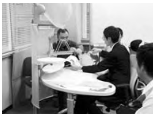
ワークショップの様子 At the workshop

また、課題は三つあります。一つ目は、継続的な実施。そこにはUDマインドの醸成という教育的な視点も含まれています。二つ目は、UD開発プロジェクトの中で、ユーザー参加のプロセスのノウハウを確立することです。三つ目は、小冊子(語録)の発行です。ワークショップを通して得られた気付きや発見、工夫をわかりやすい言葉でまとめ、会員全員で共有したいと考えています。