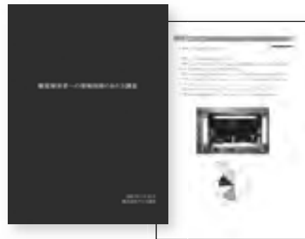
「聴覚障害者への情報保障のあり方調査」の報告書 Report re-garding the expectations of people with hearing difficulties with regard to information accessibility

後2ヵ月で400件を超えるアクセスがありました。最近はおとんどのIAUDイベントで情報保障が考慮されるようになり、意識の高まりを感じます。しかし、京都国際会議などでの利活用を考えると、まだまだ研究と情報が不足しています。今後は研究開発企画部会・標準化研究WGの中で、研究テーマの一つとして継続して取り組んでいく予定です。