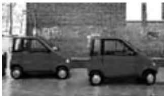
オランダのバーゲンベルグ社が開発した「カンタ」 'Canta' developed by Waaijberg of Netherlands

企業にとっては、どうでしょうか。オランダにあるバーゲンベルグ (The Waaijberg) という会社は、「カンタ (Canta)」という特殊な車を作っています。経営者がなぜこの車を開発した