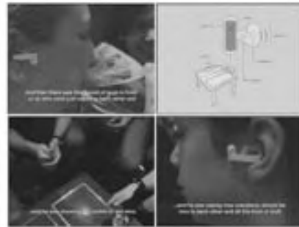
小型マイクがついたヒアウェアの製品。たとえ雑踏の中でも、相手の話し声をクリアに聴き取ることができる。

バーがイヤホンをします。誰かが話しているのを聞きたい時、前かがみになってこのループの中に体を入れると、イヤホンから相手の話し声がクリアに聞こえてきます。逆に、話に加わる必要がなければ、身体を反らしてループから外れば、相手の声は聞こえなくなります。例えば、会議場のように騒音がある場所でも、相手の会話をクリアに聴き取れます。誰でも直感的に利用できる点で、大変優れていると思います。