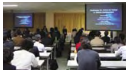
2004年度第5回定例研究会 (東芝 本社) 5th Regular Study Session, Fiscal 2004 (Toshiba Corporation's Head Office)