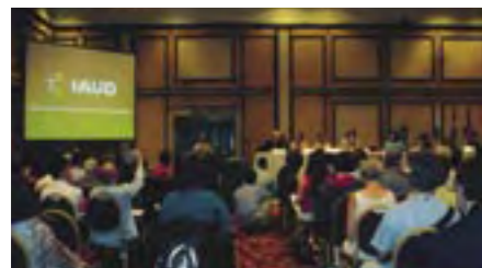
ユニヴァーサルデザインに関する国際会議開会式 (ブラジル・リオデジャネイロ) Opening Ceremony, International Conference on Universal Design (Rio de Janeiro, Brazil)