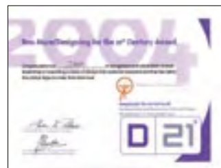
ロン・メイス賞の賞状 Ron Mace/Designing for the 21st Century Award Certificate