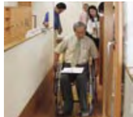
2004年度第2回定例研究会 (積水ハウス 納得工房) 2nd Regular Study Session, Fiscal 2004 (Nattoku Koubou, Sekisui House, Ltd.)