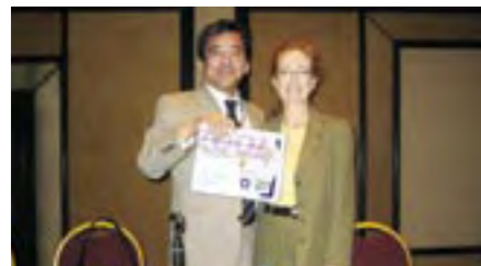
ユニヴァーサルデザインに関する国際会議にて、ロン・メイス賞を受賞 (ブラジル・リオデジャネイロ) Received Ron Mace/Designing for the 21st Century Award, International Conference on Universal Design (Rio de Janeiro, Brazil)