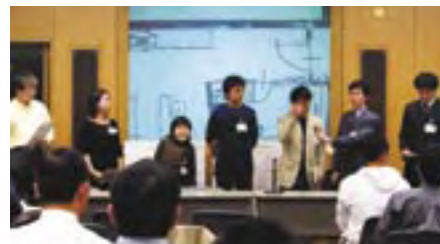
ユニヴァーサルデザインワークショップ 発表風景 (三菱電機労働組合総合施設 MELONDIA あざみ野) Presentation, Universal Design Workshop (MELONDIA Azamino, training facility owned by the Mitsubishi Electric workers' union)