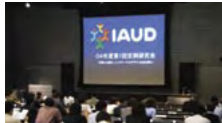
2004年度第1回定例研究会 (松下電器産業 パナソニックセンター) 1st Regular Study Session, Fiscal 2004 (Panasonic Center, Matsushita Electric Industrial Co., Ltd.)