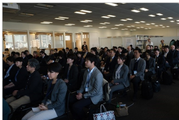
満員となった表彰式会場