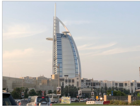
スーク(市場)の様子(写真左)と7つ星ホテル「ブルジュ・アル・アラブ」