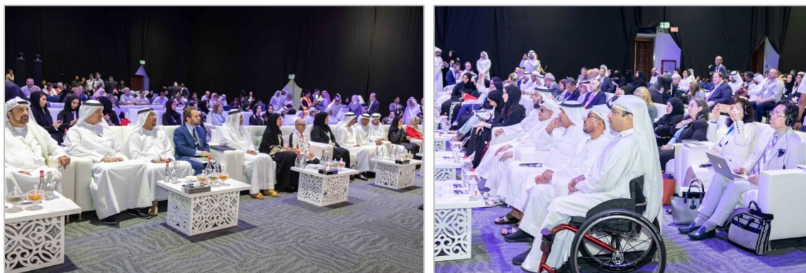
熱心にセッションを聴講する参加者(写真左の最前列はアラブ諸国の王族、政府高官の方々)