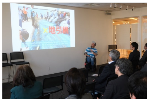
大賞と金賞受賞者によるプレゼンテーションの様子