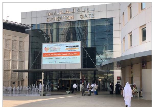
サミット会場の世界貿易センター

サミット総裁であるアハマド・ビン・サイード・アル・マクトゥーム殿下は、現在のドバイ首長ムハンマド・ビン・ラーシド・アル・マクトゥーム殿下の叔父にあたり、ドバイ民間航空庁長官兼エミレーツ航空会長でもあります。