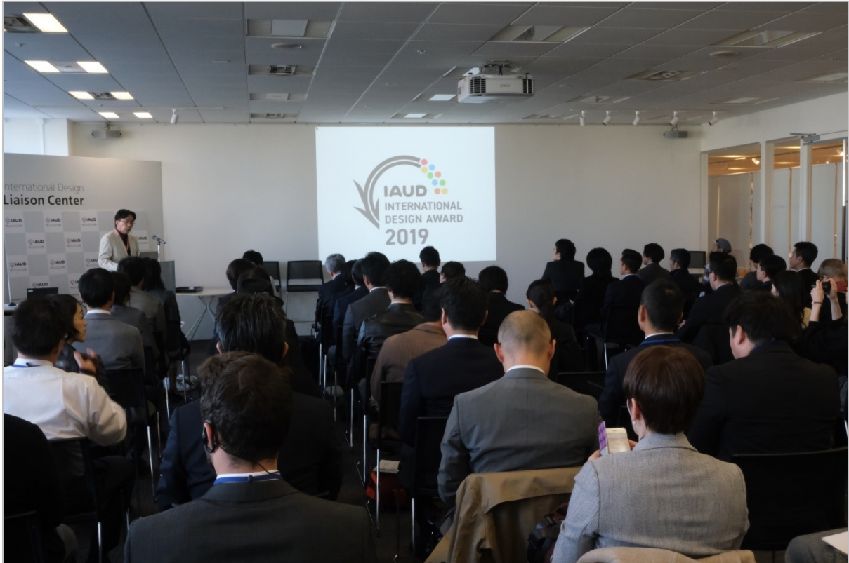
「IAUD 国際デザイン賞 2019 プレゼンテーション及び表彰式」会場の様子

一人でも多くの方が快適で暮らしやすい UD 社会の実現に向けて特に顕著な活動を表彰する「IAUD 国際デザイン賞 2019」のプレゼンテーション及び表彰式が、2019 年 12 月 18 日(水)に東京ミッドタウン インターナショナル・デザイン・リエゾンセンター(東京・赤坂)で開催され、海外 5 か国からを含む約 100 人のご参加をいただき、大変盛況のうちに終了いたしました。