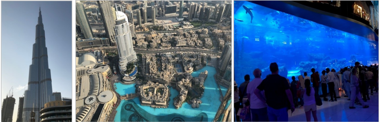
「ブルジュ・ハリファ」(写真左)の124階にある展望台(452m)から見下ろした風景と「ドバイ・モール」内のアクアリウム

ドバイでは、石油が発見される前の産業は漁業と天然真珠の輸出くらいしかありませんでしたが、日本が真珠の養殖に成功するや壊滅的な打撃を受け、世界恐慌と重なり危機的状況となったそうです。