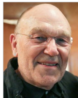
コールマン審査委員長