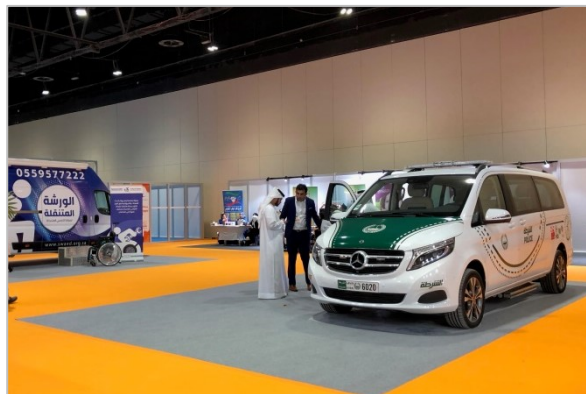
併設展示会の様子