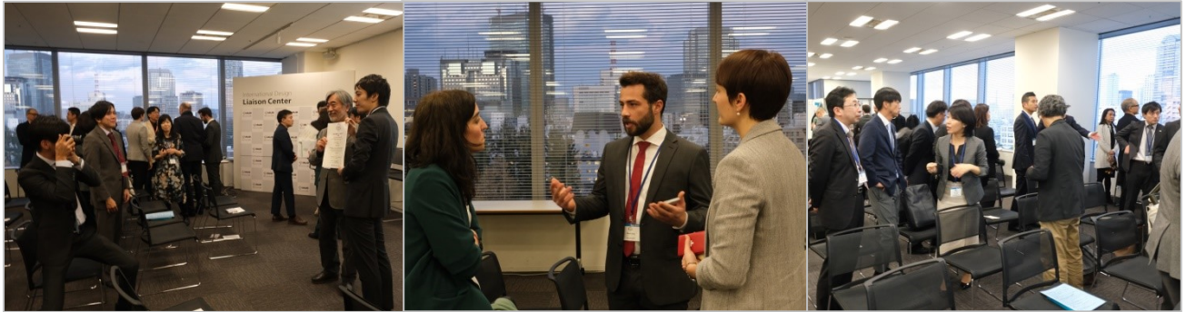
終了後は参加者同士で歓談が行われた

今年も「IAUD 国際デザイン賞 2020」を実施いたしますので、奮ってご応募いただきたくお願いいたします。応募要領は近日中に IAUD 公式サイトに掲載します。