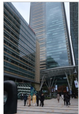
会場の東京ミッドタウン

※「IAUD 国際デザイン賞 2019 プレゼンテーション／表彰式」開催速報は こちら をご覧ください。