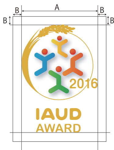
使用例)IAUDアワード2016 金賞マーク